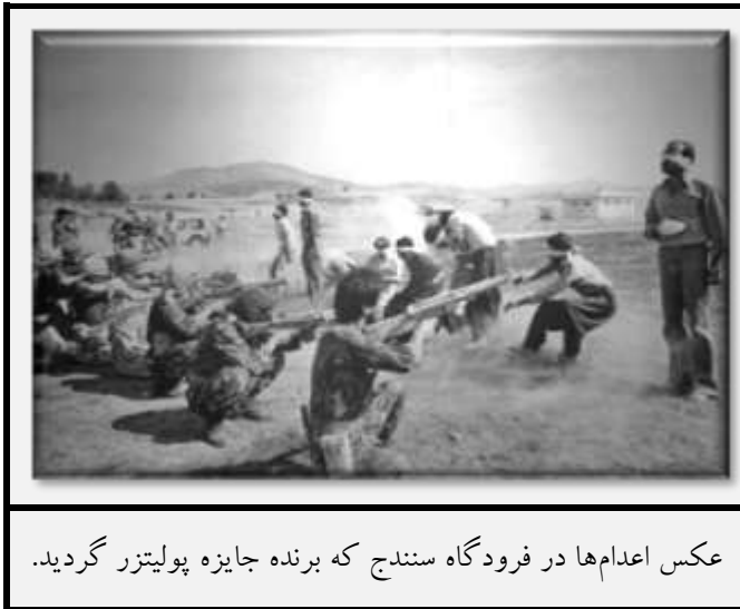
عکس اعدام‌ها در فرودگاه سنندج که برنده جایزه پولیتزر گردید.