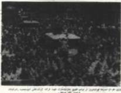
موتور باران... (Caption text describing the image)

موتور باران... (Text about the 'Motor Rain' event or protest)