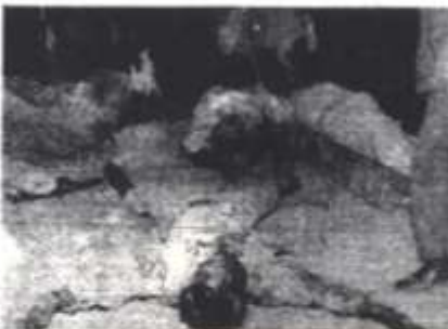
موتور باران در يادگار قربانان... (Caption text describing the image)

طالع سرخ ترمانشا: ربه شد تلازيون، نوحه خواهيد كرد. مجتل اسلام ظفاني: بنسوز امام براي سر كش به وضع منطقه و سرگوسي انزلي و اديان ملاكمه ظانين و منتقنين قرآن را بنه اين منطقه اعدام.