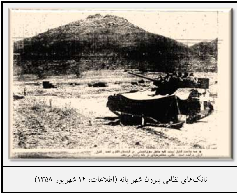
تانکهای نظامی بیرون شهر بانه (اطلاعات، ۱۴ شهریور ۱۳۵۸)

هم خلع نمودند که بر طبق گزارشها این کار به دست بنی صدر، رئیس جمهور وقت صورت گرفت که خود او هم در خرداد ۱۳۶۰ از کشور گریخت. اما به هر حال خلخالی تا زمان مرگش در سال ۱۳۸۲ کماکان از قدرت برخوردار بود و به اعمال نفوذ در امور جمهوری اسلامی ادامه داد. ۲۳