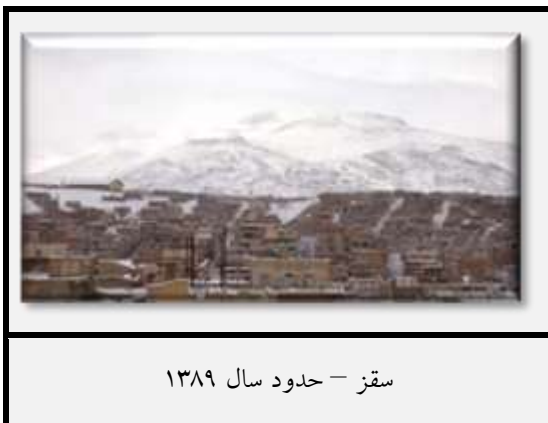
سقز - حدود سال ۱۳۸۹

در روز ۵ شهریور گزارش رسید که از زمان ورود خلخالی به نواحی غرب کردستان، ۴۵ مرد اعدام شده‌اند. ۱۶۷ آن روز خلخالی و همدستانش در حدود ۸۰ مایل به جهت شمال غرب، به طرف سقز، شهری کوچک در استان کردستان، حرکت کردند. خلخالی فوراً شروع به ترتیب دادن محاکمات در پادگان نظامی سقز کرد تا تکلیف