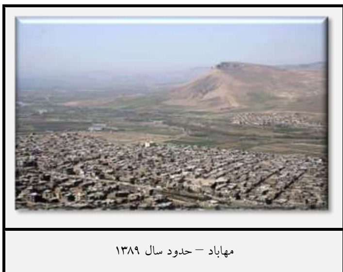
مهاباد - حدود سال ۱۳۸۹