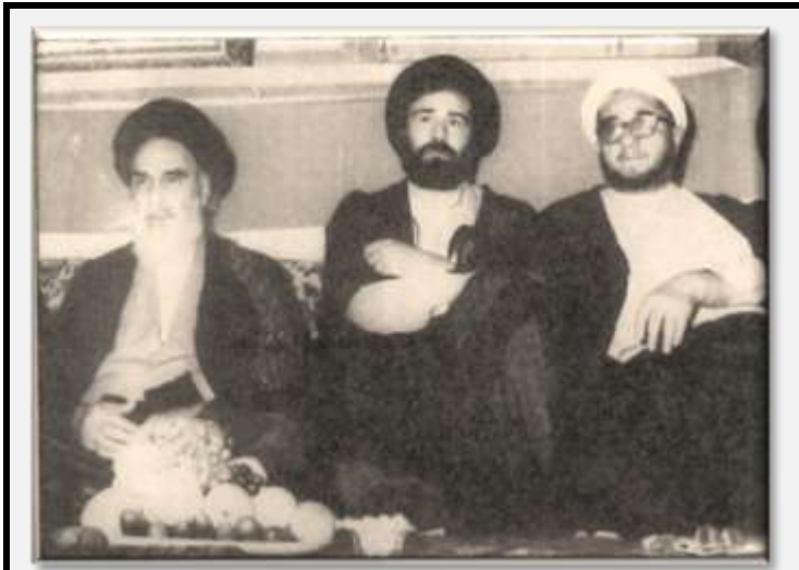
از چپ به راست: آیت‌الله خمینی، پسرش سید احمد خمینی و آیت‌الله صادق خلخالی

وارد آورد و آنها به کوهستان‌ها گریختند. ارتش مهاباد را ترک کرد تا کنترل شهر کوهستانی کوچک بانه را به دست آورد. ۷۱