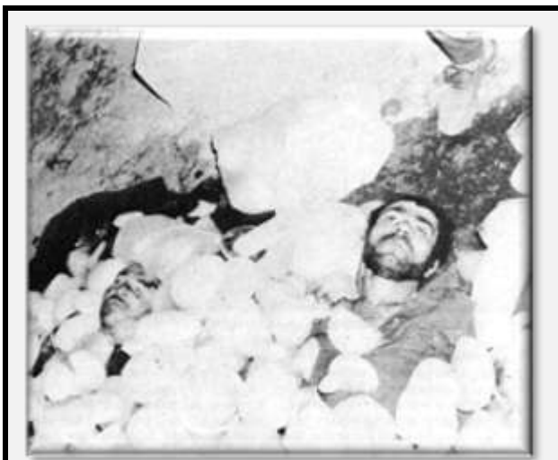
تصویر مردان کشته شده در کردستان در سال ۱۳۵۸ (اکنونمیست، ۱ سپتامبر ۱۹۷۹، ص. ۴۸)

به خانواده فیضی گفتند برای ملاقات وی که در بازداشت بود بیایند، بنابراین آنها هم برای او لباس تمیز و غذا برداشتند و با اتوبوس به طرف سقز حرکت کردند. گوهر به خاطر می‌آورد که در راه زن‌های بسیاری را دید که چادر سیاه پوشیده بودند. همانطور که به سقز نزدیک می‌شدند، حدود ۳۰۰ تا ۴۰۰ زن و مرد را دیدند که پیاده راه می‌رفتند. اتوبوس توقف کرد و راننده از آنها پرسید که آیا اتوبوس می‌تواند وارد شهر بشود. آنها پاسخ دادند که اتوبوس می‌تواند، اما شهر تحت حکومت نظامی است و توصیه کردند که از جاده‌های اصلی دور بمانند. هنگامی که مسافران علت را پرسیدند، آنها گفتند آیت‌الله خلخالی آن روز در حدود بیست تن را اعدام کرده است، از جمله پسری که هنوز ۱۶ سالش هم نبوده است. آنها همچنین گفتند که یک گروه هم اعدام نشده‌اند.