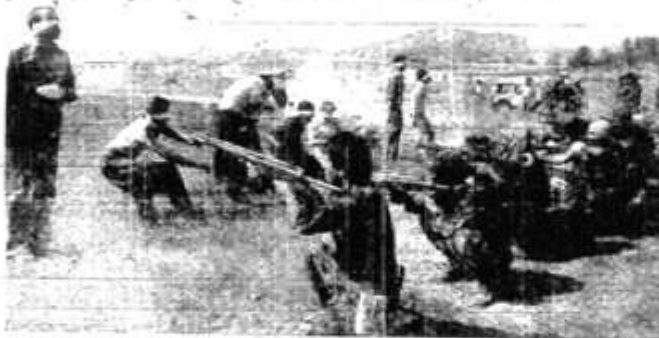
کشتی در بند مریوان در حال انفجار است