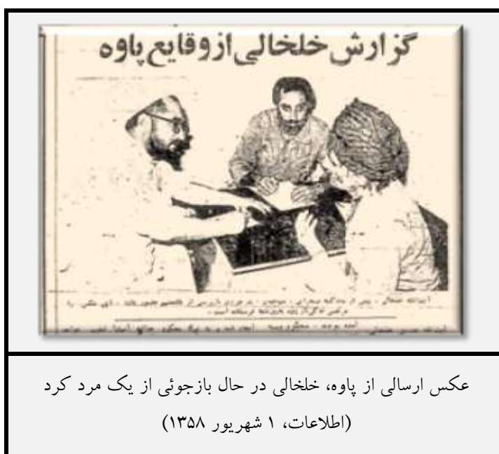
عکس ارسالی از پاوه، خلخال در حال بازجویی از یک مرد کرد (اطلاعات، ۱ شهریور ۱۳۵۸)

«دکتر ابوالقاسم رشوندی سرداری متولد تهران به عنوان محاربه با خدا ... روز جمعه ۵۸/۵/۲۶ ... از تهران عازم پاوه شد تا به کمک مجروحان جنگ پاوه بپردازد. بنابراین هرگونه اتهامی مبنی بر دخالت وی در جنگ ناخواسته پاوه مردود است. ... ما خواهان ... محکوم نمودن عاملان آن [اعدامها] هستیم.» ۱۰۵