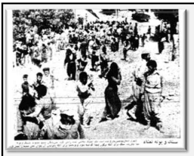
مردان و زنان کرد در حال حمل نعا و سنگ برای دفن اجساد (اطلاعات، ۲۹ مرداد ۱۳۵۸)

کرده‌اند و اجسادشان در بیمارستان است. ۱۳۱