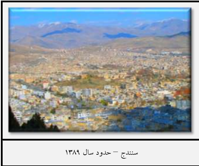
سنندج - حدود سال ۱۳۸۹

مقصد بعدی خلخال سنندج، مرکز استان کردستان و مرکز فعالیت‌های اقتصادی و اجتماعی منطقه بود. ۱۴۲ اگرچه معلوم نیست آیا وی در روز ۴ یا ۵ شهریور به آنجا وارد شده است، اما گزارش شده که وی در روز ۵ شهریور دستور یک سری اعدام‌ها را صادر نموده است و این اعدام‌ها در همان روز اجرا شده‌اند. ۱۴۳ خلخال مانند آنچه که در پاوه و مریوان انجام داده بود، از مردها و