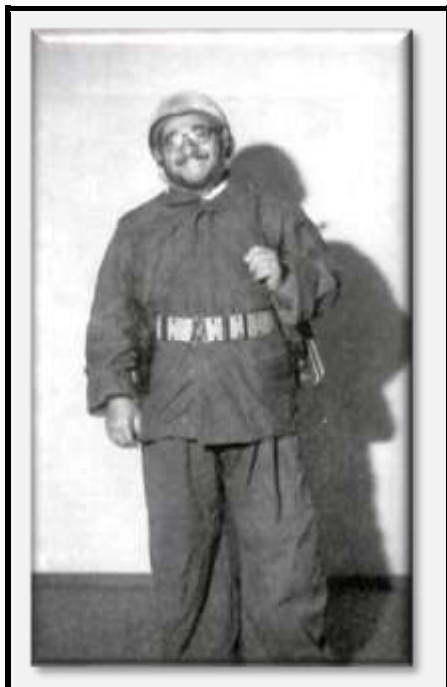
آیت‌الله خلخالی در اونیفورم نظامی (از کتاب خاطراتش)

شکی ندارد که «مرحله نظامی از ترس وحشتی که به وسیله خلخالی و قاتلاناش ایجاد شده بود و با استفاده گسترده از نیروی هوایی و هلیکوپترها انجام می‌گرفت.» ۷۵