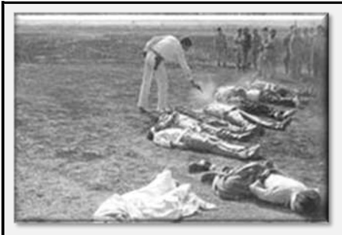
علی کریمی، یکی از محافظان خلخال، در حال اعدام کردها

عکس‌های بعدی بعضی از مردها را نشان می‌دهد که در اثر اصابت گلوله مأموران اعدام به ایشان، در حال به زمین افتادن هستند. یک مرد در حالیکه افراد اطراف وی در اثر اصابت گلوله به زمین می‌افتند، دستش را بیهوده برای دفاع بلند کرده است. در عکس‌های بعدی قربانیان، از پای درآمده و بر زمین افتاده‌اند در حالیکه مردی که