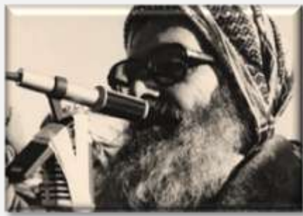
شیخ عزالدین حسینی

(۱۳۸۹-۱۳۰۱) یکی از رهبران روحانی کرد و امام جمعه مهاباد بود. پیش از انقلاب سال ۱۳۵۷ وی رهبری تظاهرات علیه حکومت شاه را به عهده داشت. در سال‌های نخستین پس از انقلاب، شیخ عزالدین یکی از مذاکره‌کنندگان اصلی کرد بوده و از حمایت کومله برخوردار بود. وی در بهمن ماه ۱۳۸۹ در سوئد، کشوری که بیست سال آخر حیاتش را در آن در تبعید گذراند، درگذشت.