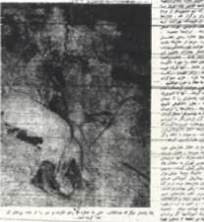
تشييع جنازه صدها هزار فقري... (Caption text describing the image)